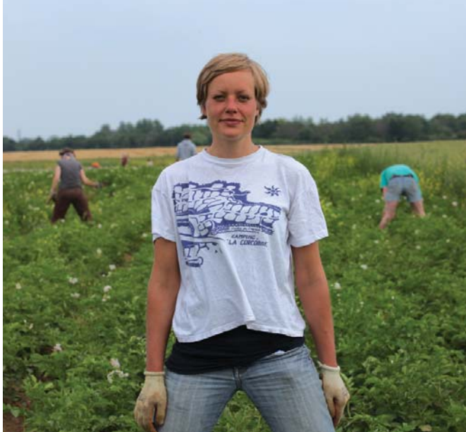
© 10 Billion, what's on Your Plate ?